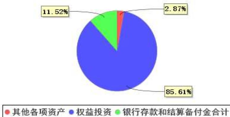
投资组合资产配置图表(2021年6月30日)