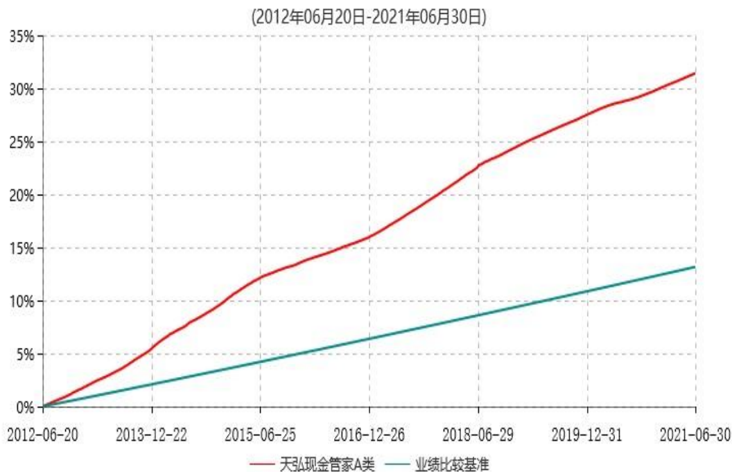
天弘现金管家A类累计净值收益率与业绩比较基准收益率历史走势对比图