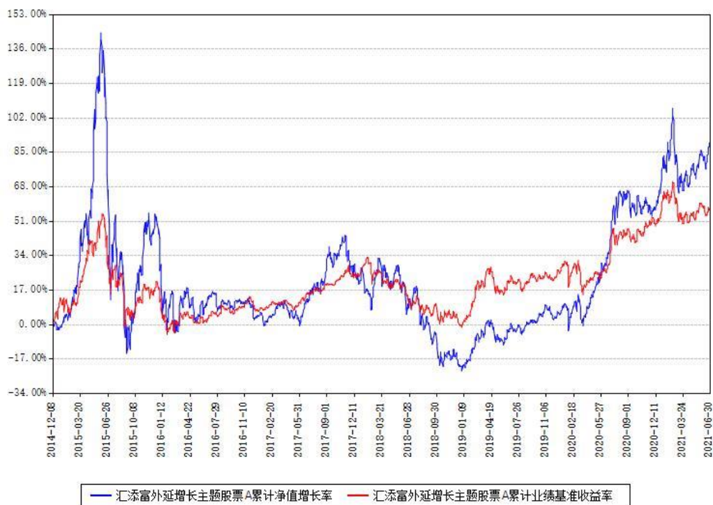
汇添富外延增长主题股票A累计净值增长率与同期业绩基准收益率对比图