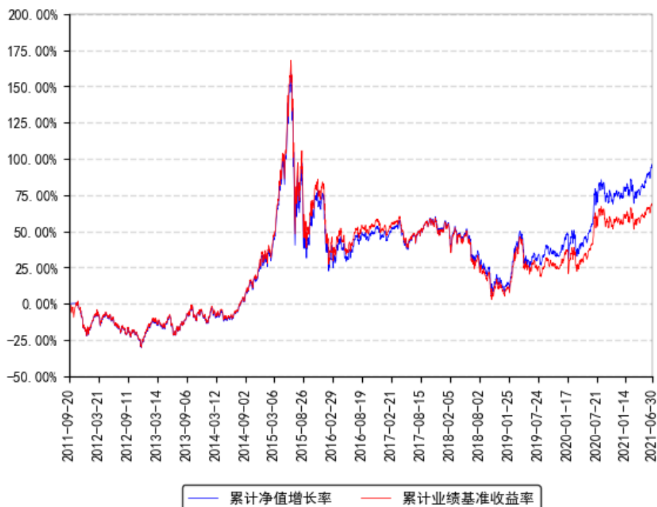
南方上证380ETF联接A累计净值增长率与同期业绩比较基准收益率的历史走势对比图