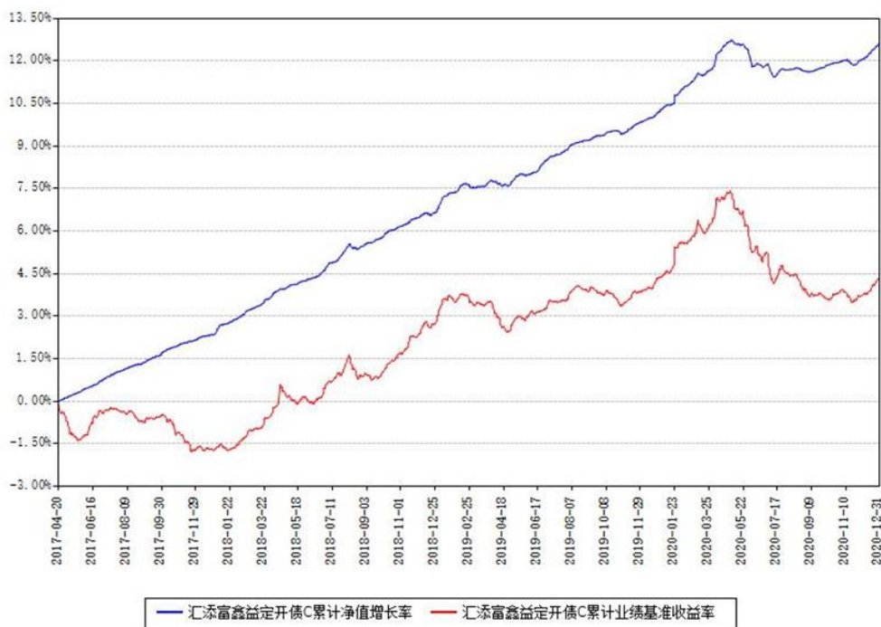
汇添富鑫益定开债C累计净值增长率与同期业绩基准收益率对比图