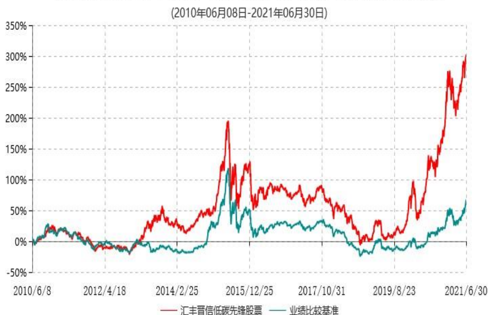
汇丰晋信低碳先锋股票型证券投资基金累计净值增长率与业绩比较基准收益率历史走势对比图