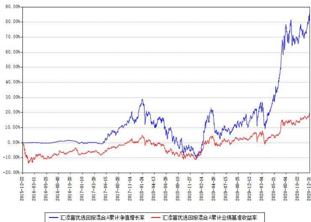
汇添富优选回报混合A累计净值增长率与同期业绩基准收益率对比图