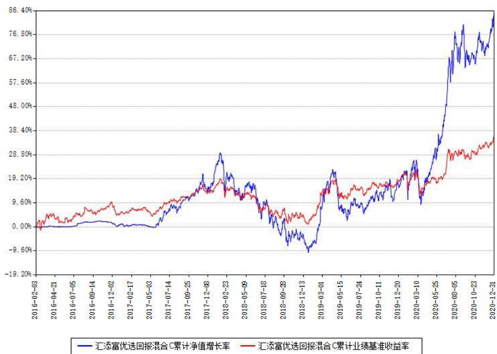
汇添富优选回报混合C累计净值增长率与同期业绩基准收益率对比图