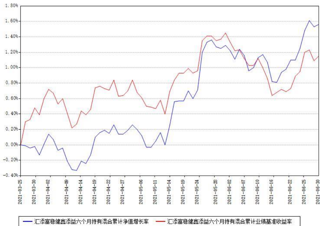
汇添富稳健鑫添益六个月持有混合累计净值增长率与同期业绩基准收益率对比图