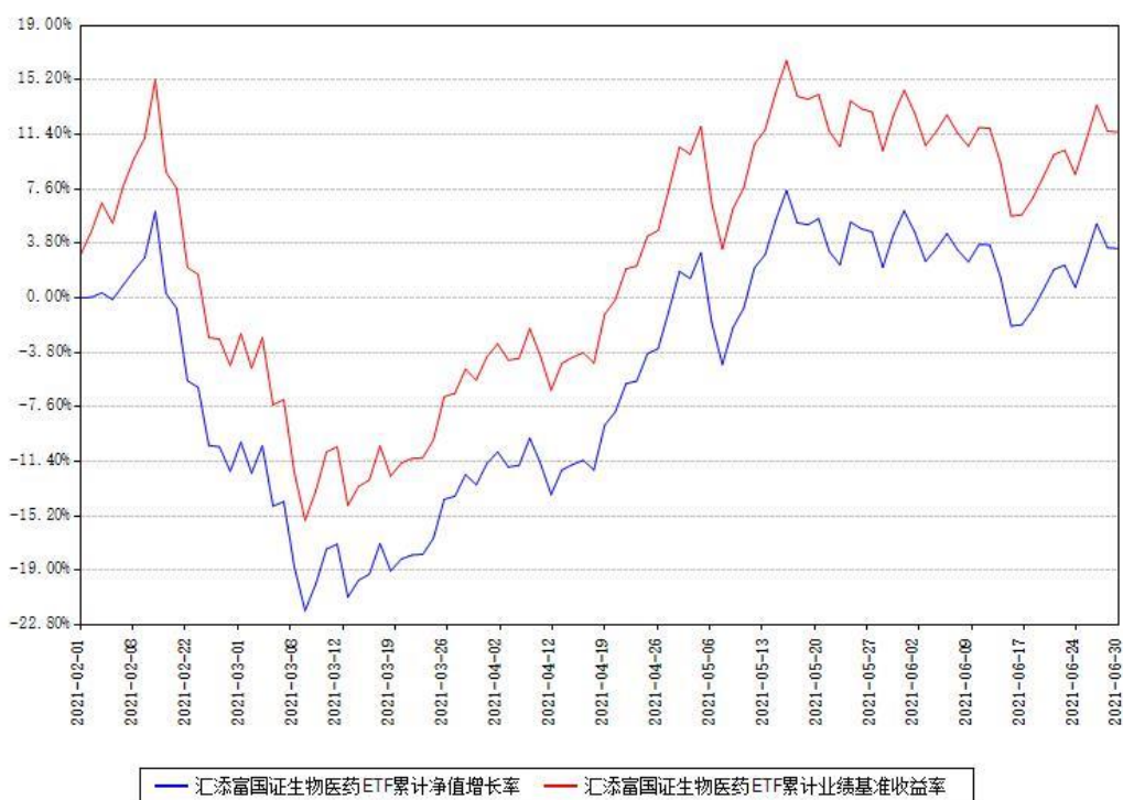
汇添富国证生物医药ETF累计净值增长率与同期业绩基准收益率对比图