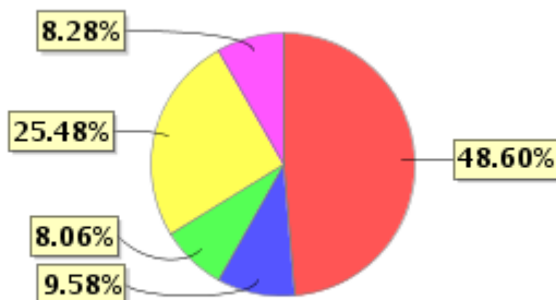
投资组合资产配置图表(2021年6月30日)

● 固定收益投资 ● 买入返售金融资产 ● 其他各项资产 ● 权益投资 ● 银行存款和结算备付金合计