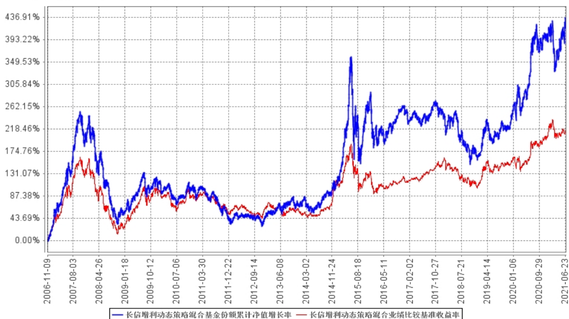
长信增利动态策略混合基金份额累计净值增长率与同期业绩比较基准收益率的历史走势对比图

自合同生效之日（2006年11月9日）至2021年6月30日期间，本基金份额累计净值增长率与同期业绩比较基准收益率历史走势对比：