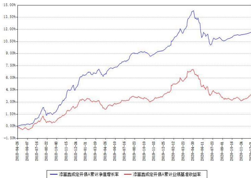
添富鑫成定开债A累计净值增长率与同期业绩基准收益率对比图

(二) 自基金合同生效以来基金累计净值增长率变动及其与同期业绩比较基准收益率变动的比较图