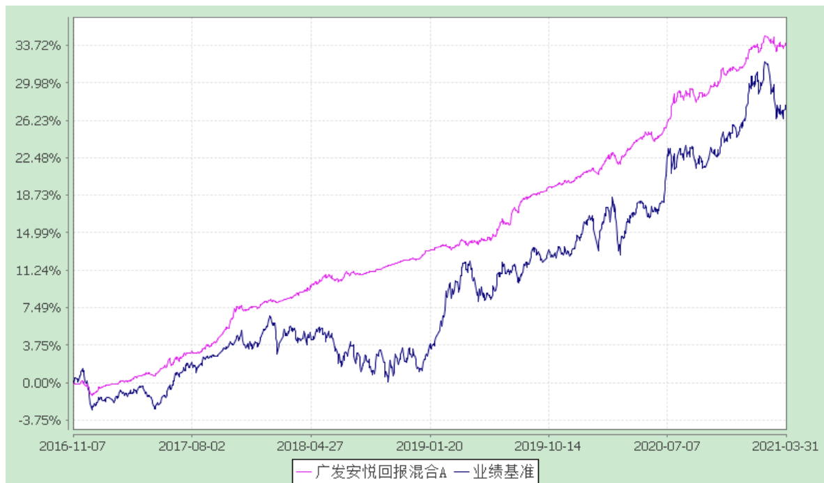
广发安悦回报混合 C: