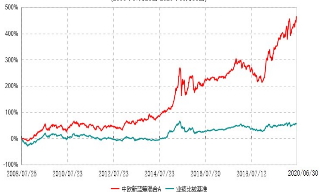
中欧新蓝筹混合E累计净值增长率与业绩比较基准收益率历史走势对比图