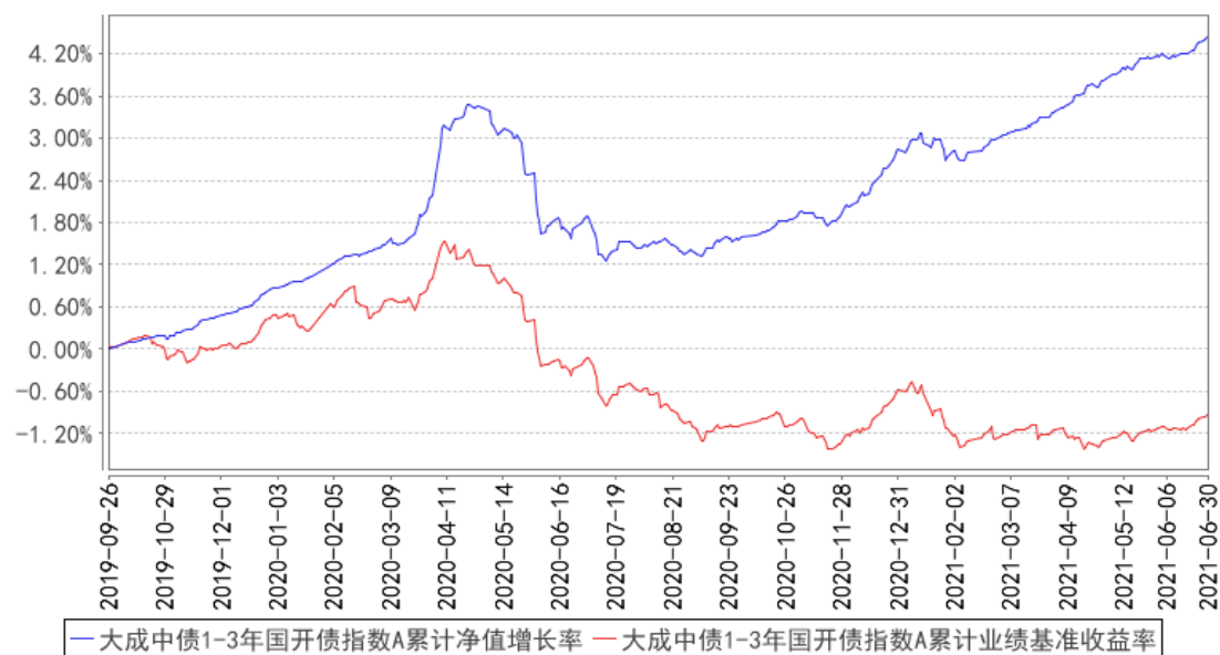
大成中债1-3年国开债指数A累计净值增长率与同期业绩比较基准收益率的历史走势对比图