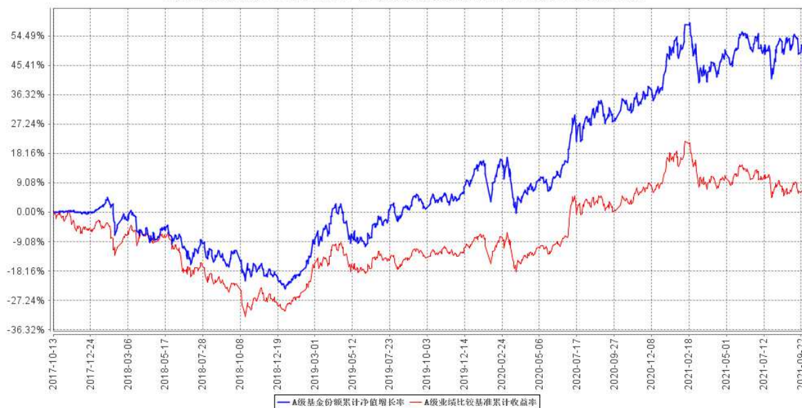
A 级基金份额累计净值增长率与同期业绩比较基准收益率的历史走势对比图