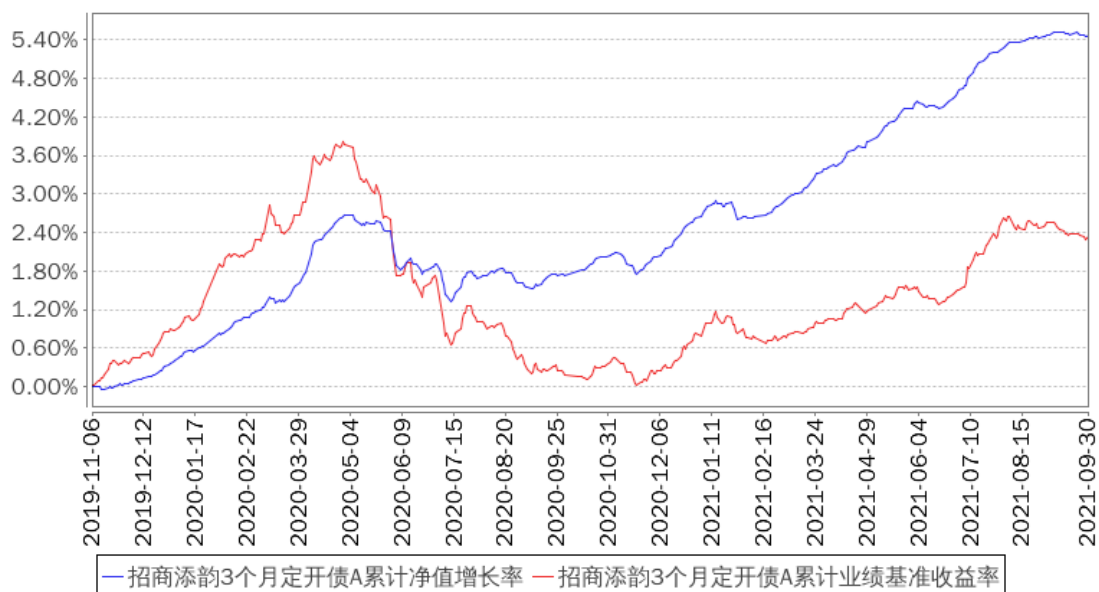
招商添韵3个月定开债A累计净值增长率与同期业绩比较基准收益率的历史走势对比图