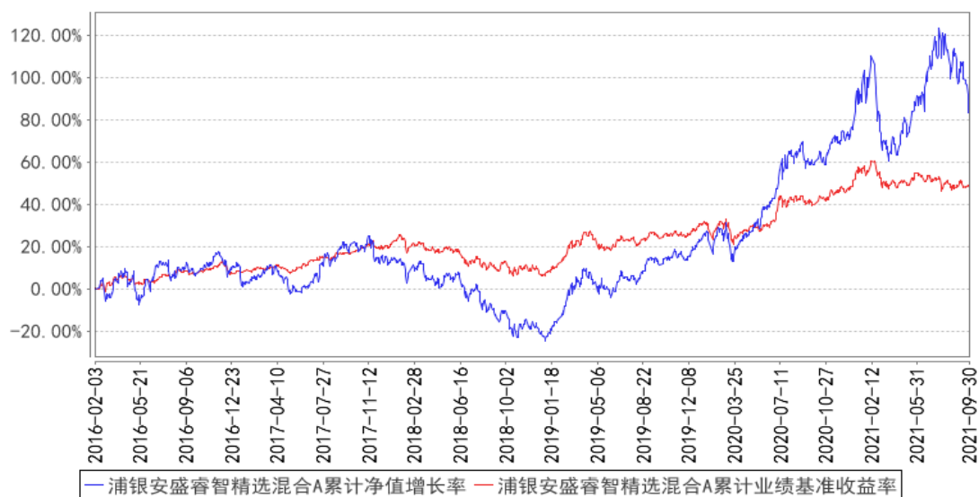
浦银安盛睿智精选混合A累计净值增长率与同期业绩比较基准收益率的历史走势对比图