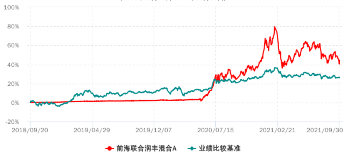
前海联合润丰混合A累计净值增长率与业绩比较基准收益率历史走势对比图 (2018年09月20日-2021年09月30日)