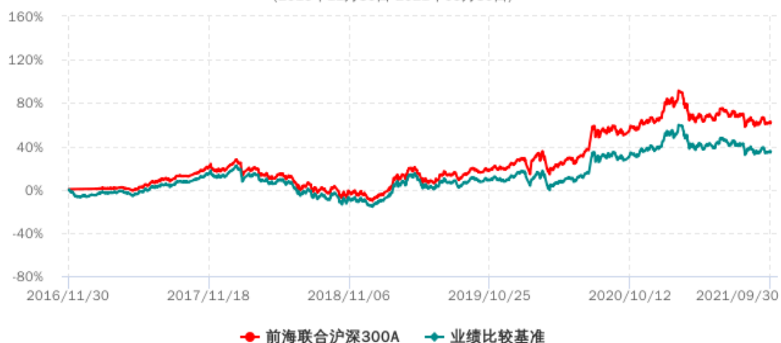
前海联合沪深300A累计净值增长率与业绩比较基准收益率历史走势对比图 (2016年11月30日-2021年09月30日)