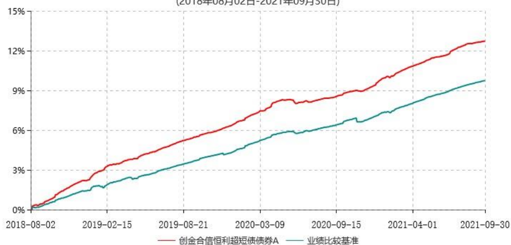
创金合信恒利超短债债券A累计净值增长率与业绩比较基准收益率历史走势对比图 (2018年08月02日-2021年09月30日)