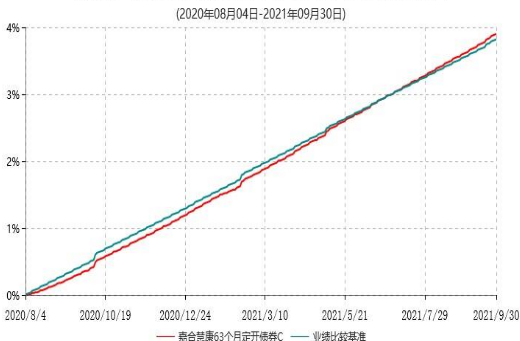
嘉合慧康63个月定开债券C累计净值增长率与业绩比较基准收益率历史走势对比图

注：本基金基金合同于 08 月 04 日生效，按照基金合同规定，本基金建仓期为基金合同生效之日起 6 个月。建仓期结束时，本基金的各项资产配置比例符合基金合同约定。