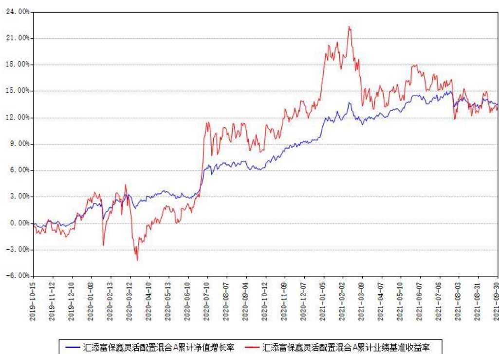
汇添富保鑫灵活配置混合A累计净值增长率与同期业绩基准收益率对比图