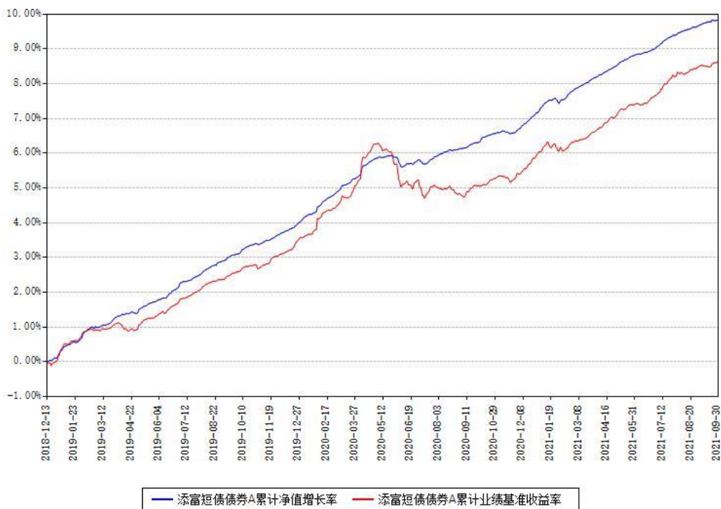
添富短债债券A累计净值增长率与同期业绩基准收益率对比图