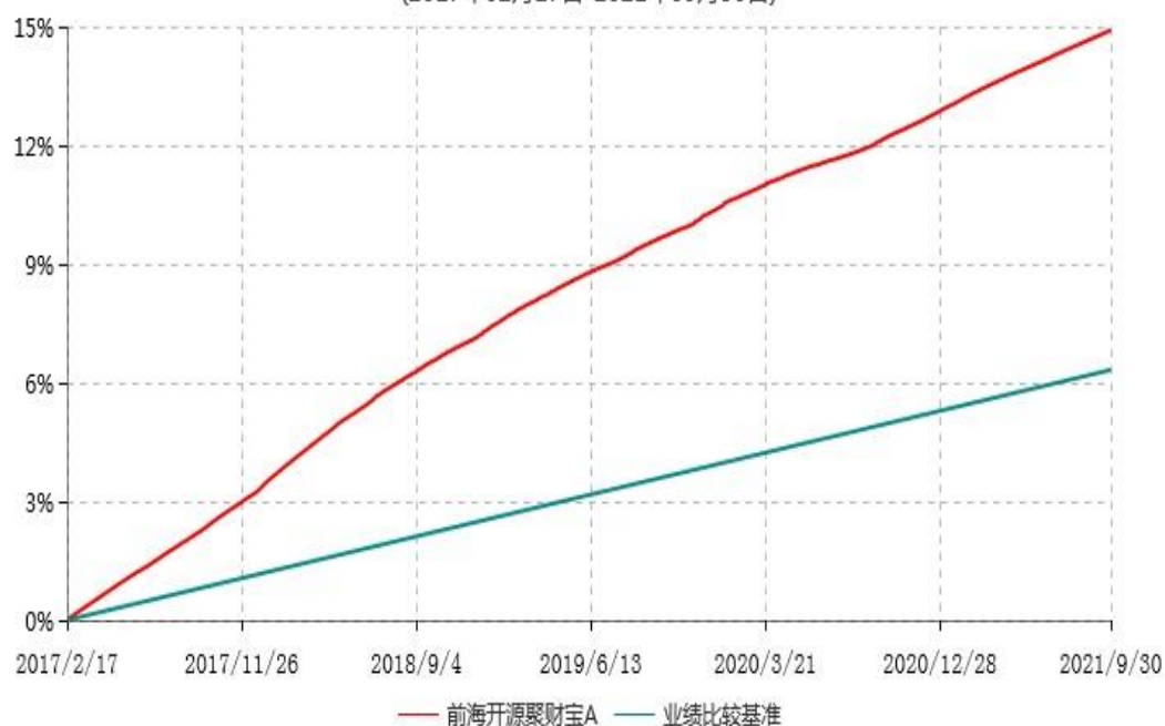
前海开源聚财宝A累计净值收益率与业绩比较基准收益率历史走势对比图 (2017年02月17日-2021年09月30日)