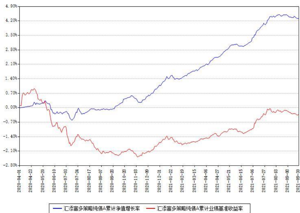
汇添富多策略纯债A累计净值增长率与同期业绩基准收益率对比图