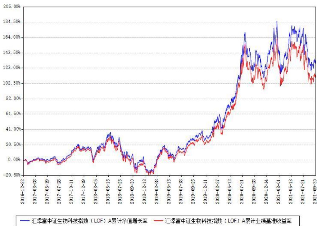
汇添富中证生物科技指数（LOF）A累计净值增长率与同期业绩比较基准收益率对比图