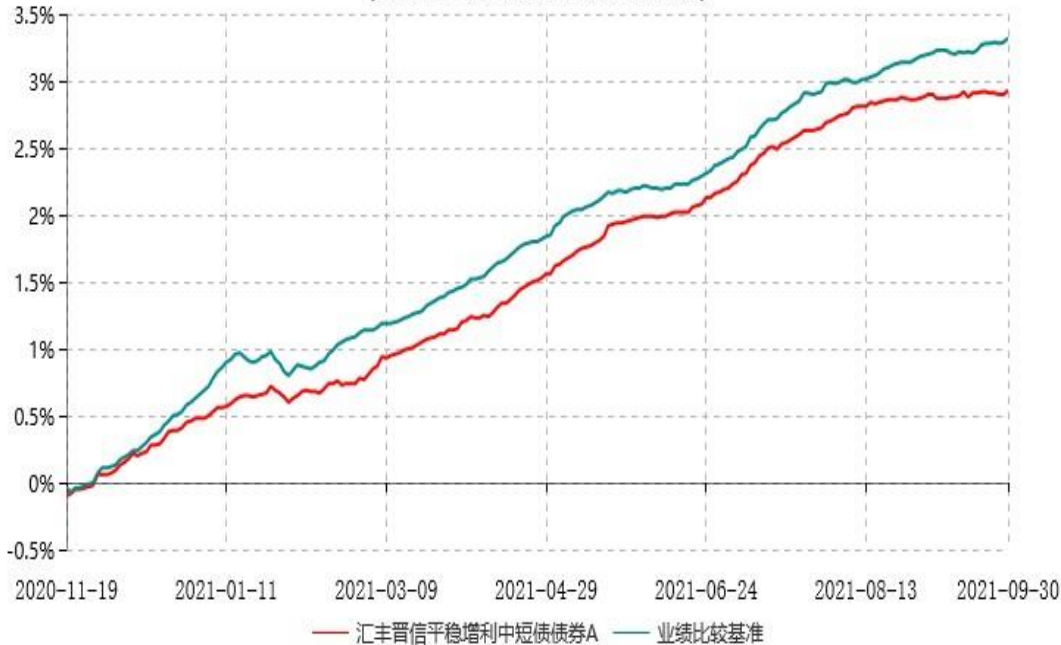
汇丰晋信平稳增利中短债债券A累计净值增长率与业绩比较基准收益率历史走势对比图 (2020年11月19日-2021年09月30日)

注：1、自 2020 年 11 月 19 日起，原汇丰晋信平稳增利债券型证券投资基金转型为汇丰晋信平稳增利中短债债券型证券投资基金，汇丰晋信平稳增利中短债债券型证券投资基金基金合同正式生效，截至 2021 年 9 月 30 日基金合同生效未满 1 年。