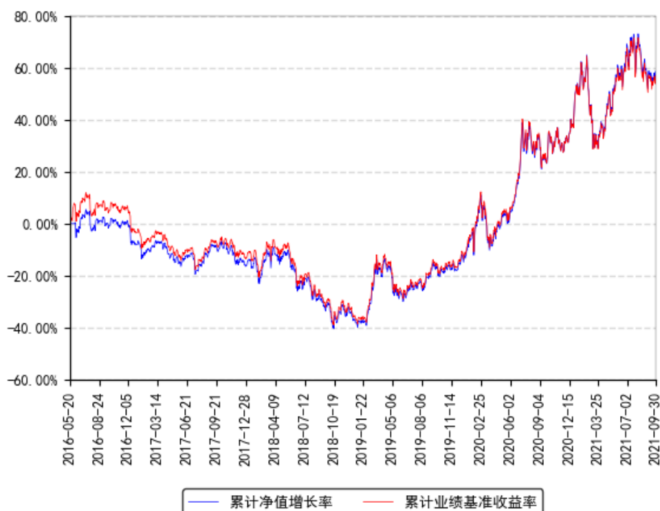
南方创业板ETF联接A累计净值增长率与同期业绩比较基准收益率的历史走势对比图