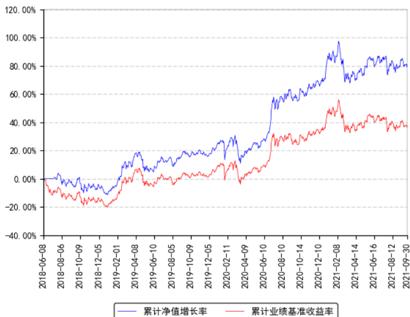
MSCI 中国A股国际通ETF发起联接A累计净值增长率与同期业绩比较基准收益率的历史走势对比图