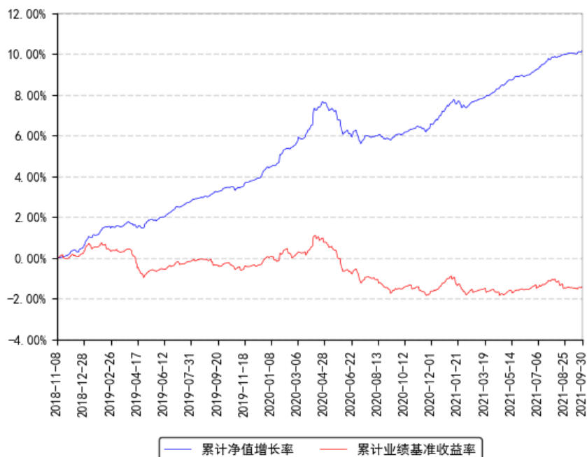
南方中债 1-3 年国开行债券指数 A 累计净值增长率与同期业绩比较基准收益率的历史走势对比图