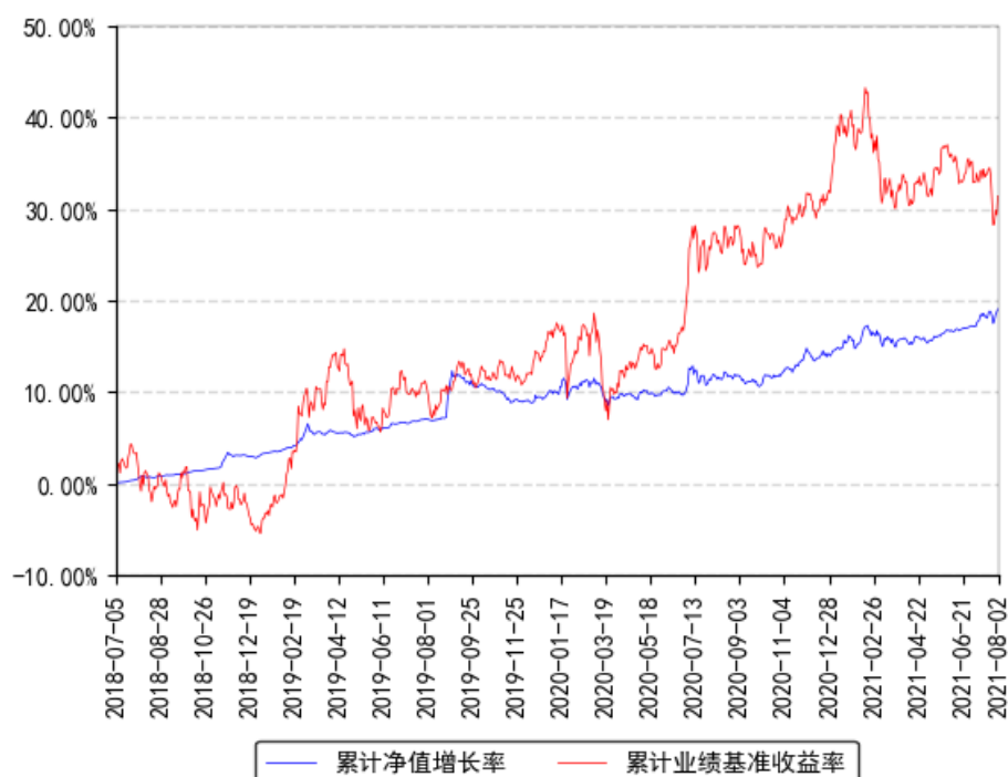
南方3年封闭战略配售混合累计净值增长率与同期业绩比较基准收益率的历史走势对比图