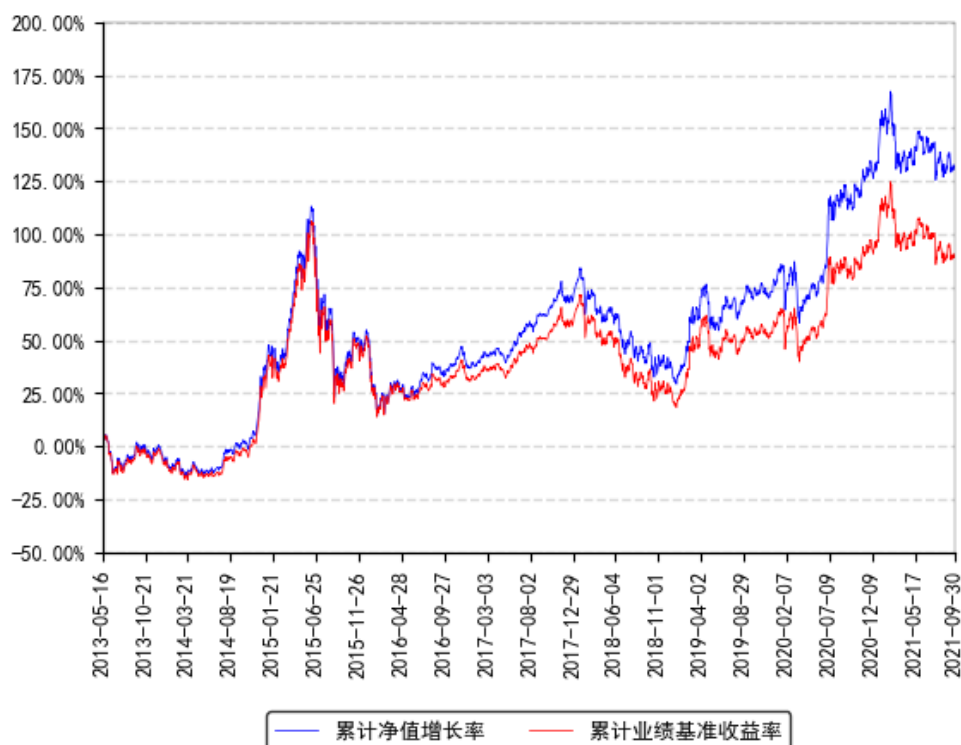
南方沪深300ETF联接累计净值增长率与同期业绩比较基准收益率的历史走势对比图