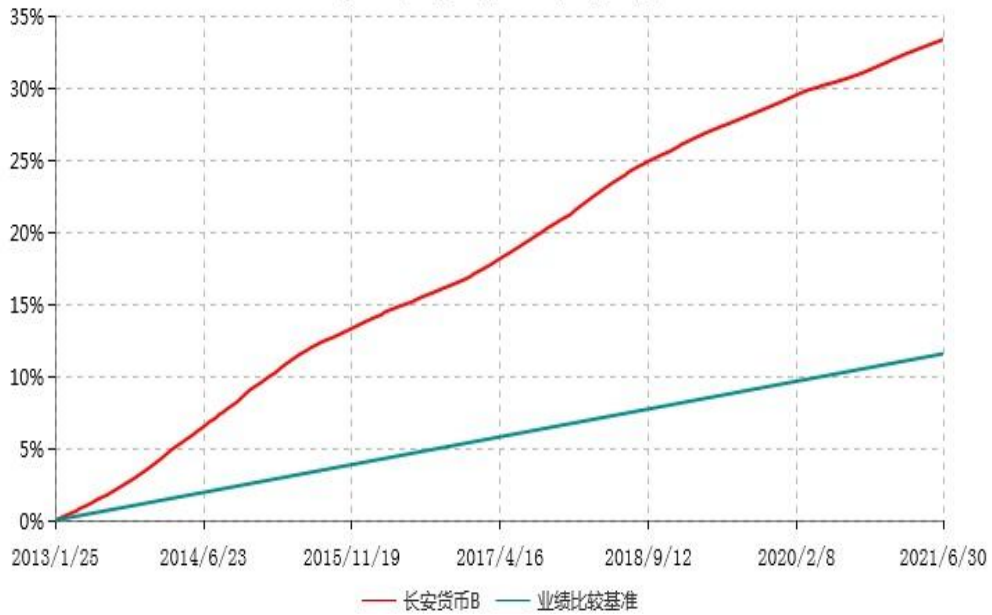
长安货币B累计净值收益率与业绩比较基准收益率历史走势对比图 (2013年01月25日-2021年06月30日)

本基金的收益分配是按月结转份额。按基金合同规定，本基金自基金合同生效起 6 个月为建仓期，截止到建仓期结束时，本基金的各项投资组合比例已符合基金合同的相关规定。图示日期为 2013 年 1 月 25 日至 2021 年 6 月 30 日。