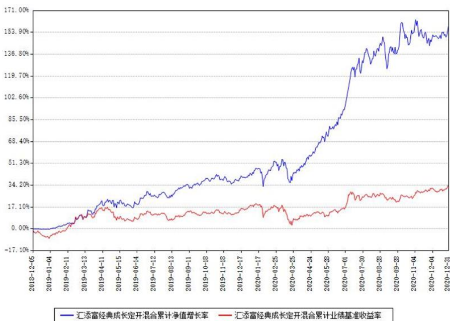
汇添富经典成长定期开混合累计净值增长率与同期业绩基准收益率对比图

(二) 自基金合同生效以来基金累计净值增长率变动及其与同期业绩比较基准收益率变动的比较图