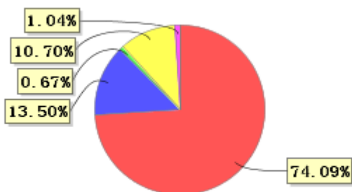
投资组合资产配置图表(2021年9月30日)

● 固定收益投资 ● 买入返售金融资产 ● 其他各项资产 ● 权益投资 ● 银行存款和结算备付金合计