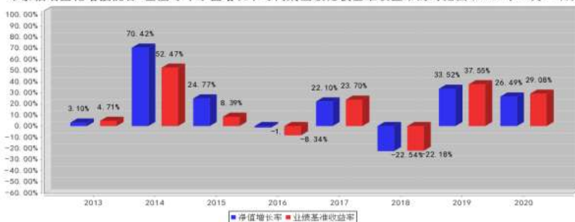
华泰柏瑞量化增强混合A基金每年净值增长率与同期业绩比较基准收益率的对比图(2020年12月31日)

注：业绩表现截止日期 2020 年 12 月 31 日。基金过往业绩不代表未来表现。