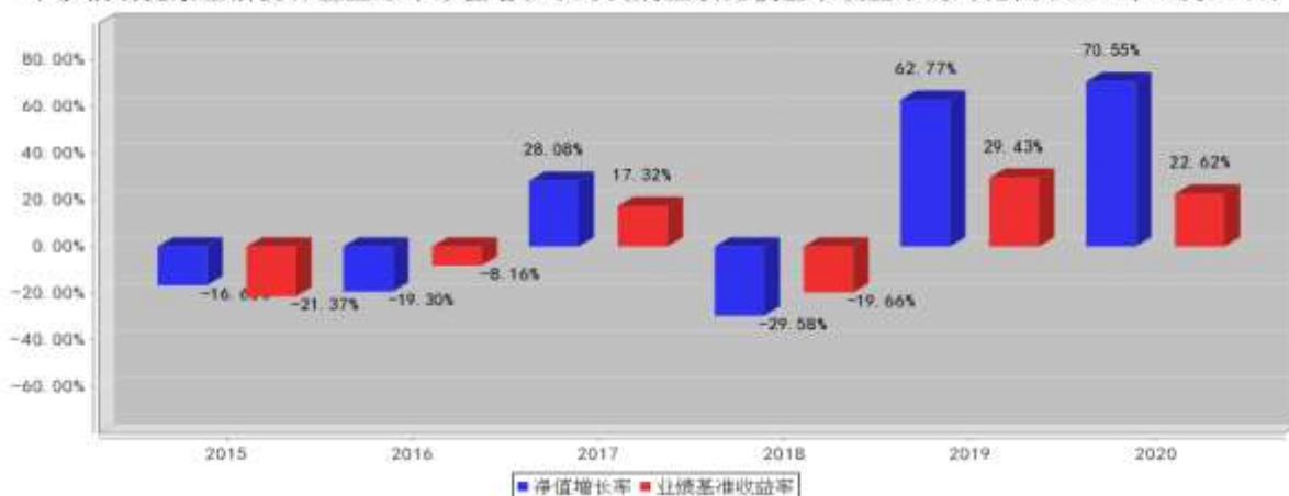
华泰柏瑞健康生活混合基金每年净值增长率与同期业绩比较基准收益率的对比图(2020年12月31日)

注:业绩表现截止日期 2020 年 12 月 31 日。基金过往业绩不代表未来表现。