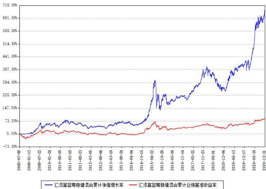
汇添富蓝筹稳健混合累计净值增长率与同期业绩基准收益率对比图