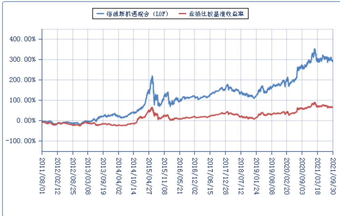
(二) 基金累计净值增长率与业绩比较基准收益率的历史走势对比图