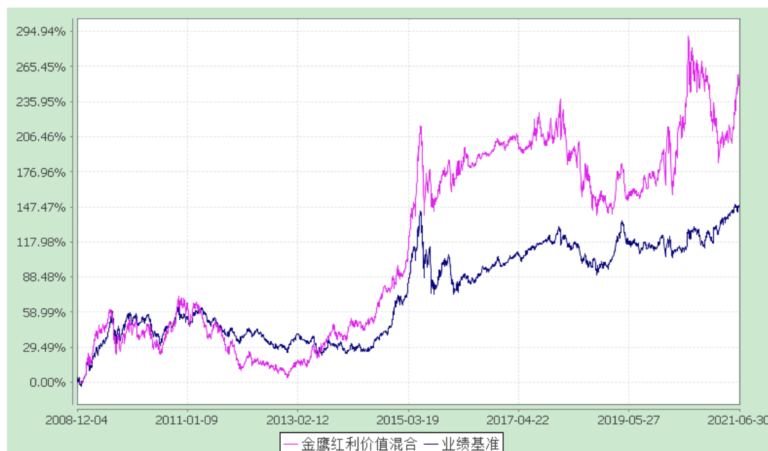
金鹰红利价值灵活配置混合型证券投资基金 累计净值增长率与业绩比较基准收益率历史走势对比图 (2008年12月4日至2021年6月30日)