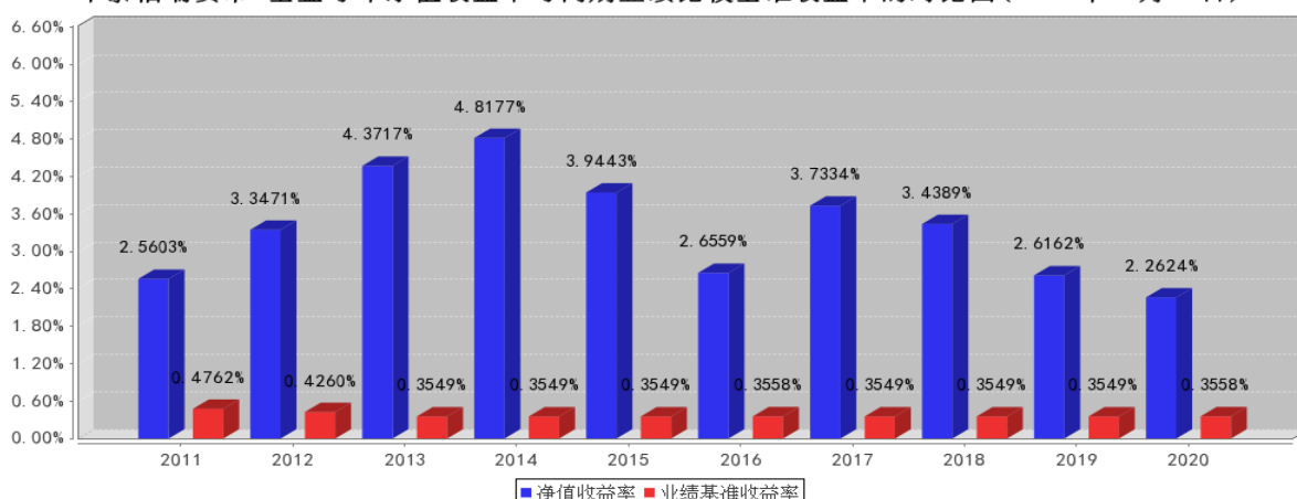
华泰柏瑞货币B基金每年净值收益率与同期业绩比较基准收益率的对比图(2020年12月31日)

注:业绩表现截止日期 2020 年 12 月 31 日。基金过往业绩不代表未来表现。