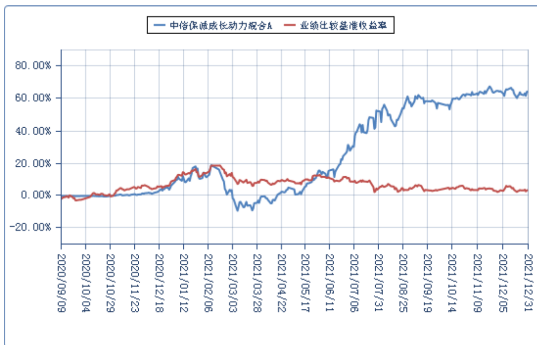
中信保诚成长动力混合 C