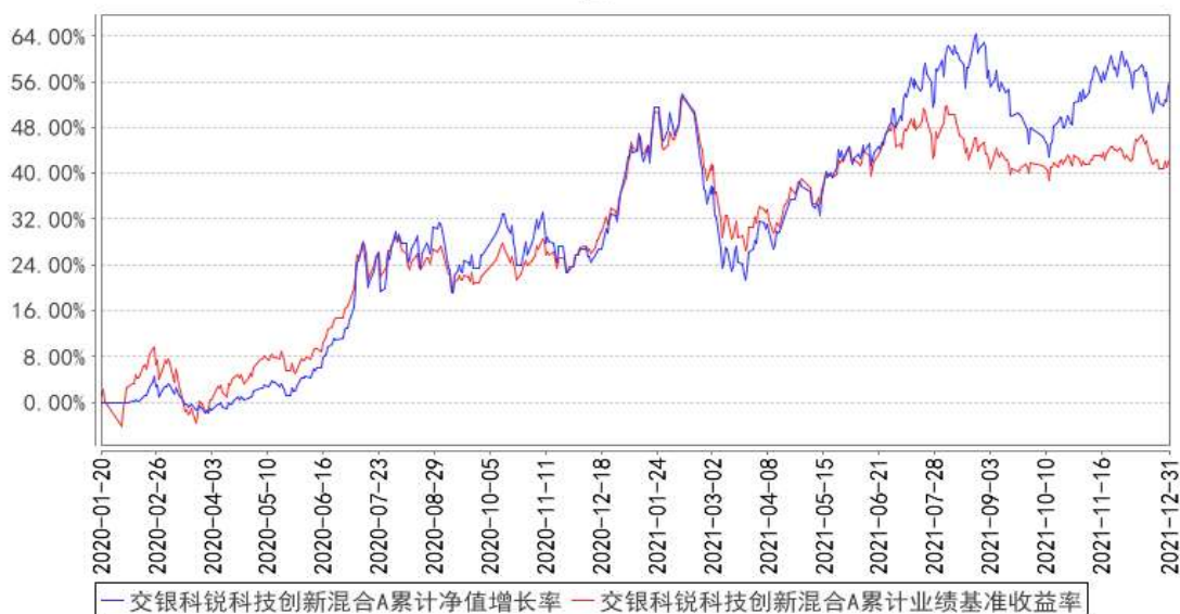
交银科锐科技创新混合A累计净值增长率与同期业绩比较基准收益率的历史走势对比图