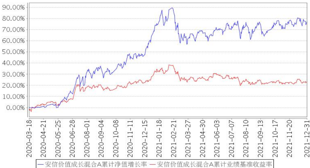
安信价值成长混合A累计净值增长率与同期业绩比较基准收益率的历史走势对比图