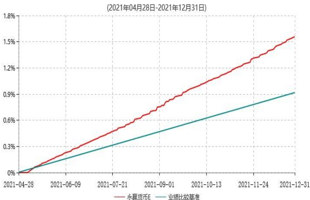
永赢货币E累计净值收益率与业绩比较基准收益率历史走势对比图

注：本基金自 2021 年 4 月 28 日增设 E 类基金份额，截至本报告期末，本类基金份额生效未满 1 年。