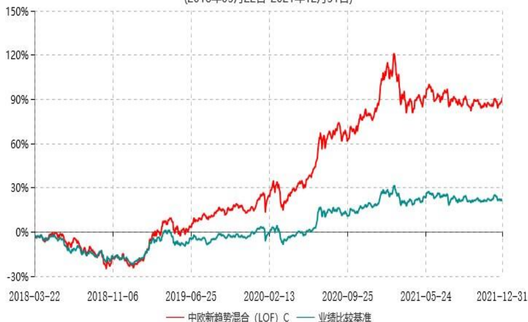
中欧新趋势混合（LOF）C 累计净值增长率与业绩比较基准收益率历史走势对比图 (2018年03月22日-2021年12月31日)

注：本基金于 2018 年 3 月 21 日新增 C 类份额，图示日期为 2018 年 3 月 22 日至 2021 年 12 月 31 日。