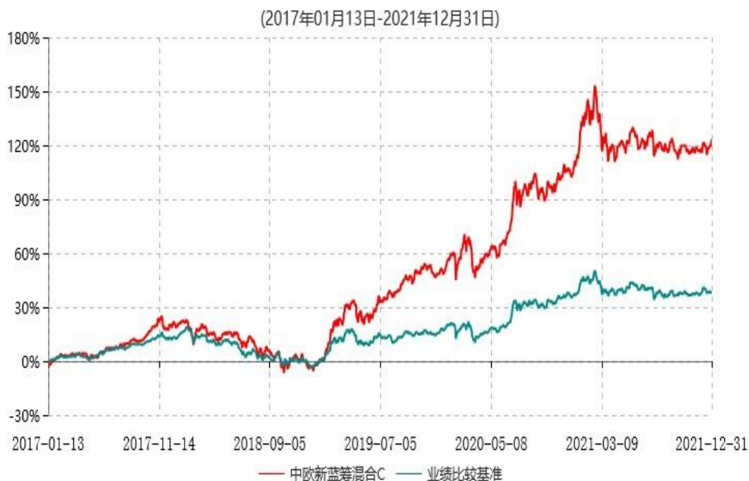
中欧新蓝筹混合C累计净值增长率与业绩比较基准收益率历史走势对比图

注：本基金于 2017 年 1 月 12 日新增 C 类份额，图示日期为 2017 年 1 月 13 日至 2021 年 12 月 31 日。