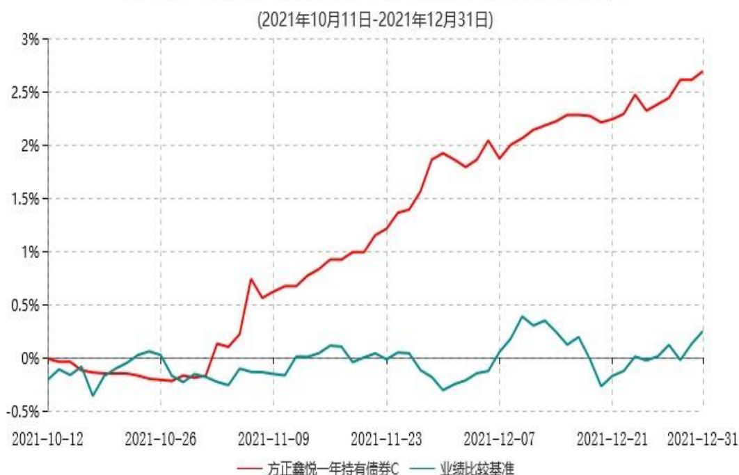
方正鑫悦一年持有债券C累计净值增长率与业绩比较基准收益率历史走势对比图

注：1、基金合同生效日为 2021 年 09 月 16 日，方正鑫悦一年持有债券 C 自 2021 年 10 月 11 日起开放申购和赎回业务。截至 2021 年 12 月 31 日，本基金合同生效不满一年。