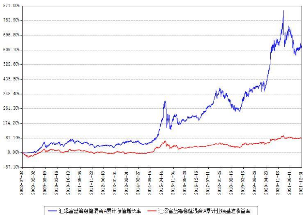
汇添富蓝筹稳健混合A累计净值增长率与同期业绩基准收益率对比图